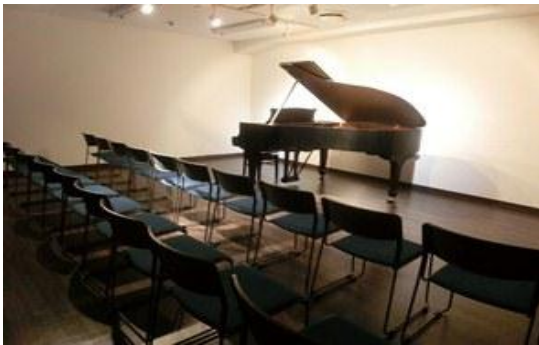
ミニコンサートの開催も可能な 50名収容のホール