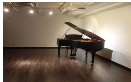
座席や机などのレイアウトはご相談ください