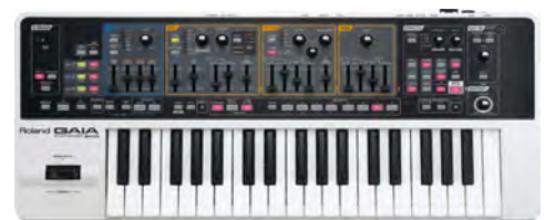
使用機材: Roland Synthesizer GAIA SH-01